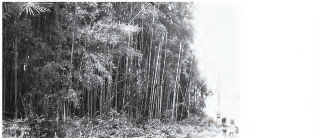
大きな古墳の大きさを測るには、平板測量で測量し、地図作り、それを計る。