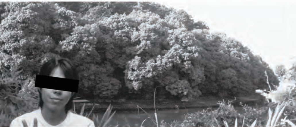
古墳の大きさは偉さではなく、古墳時代の埋葬は追葬されることが多かった。同世代の男女は兄妹の可能性が高い。