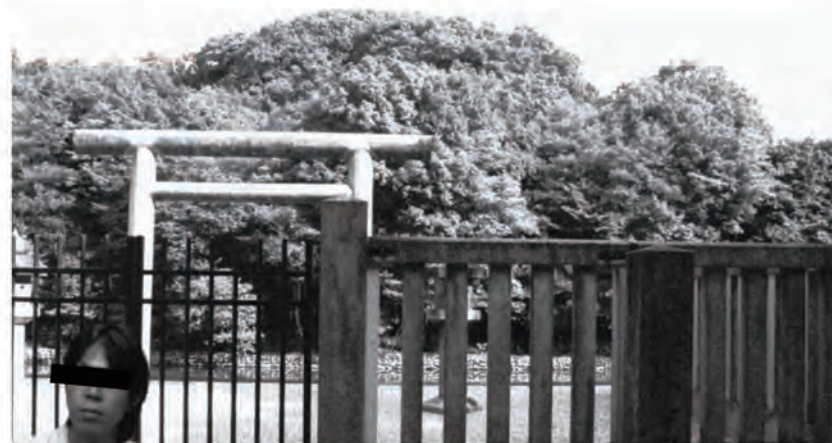
小さな古墳の大きさを測るには、巻き尺を使用。